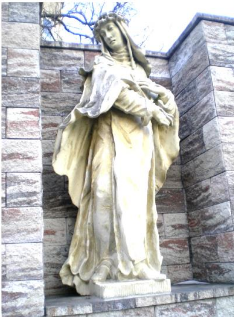
Katharina von Siena mit Dornenkrone und Stigmen, Skulptur am Haus Wien 14, Lorenz-Weiß-Gasse 6 (unbek. Künstler).

Zur Überlieferung der Gebete sowie Aktualisierung in 12 Gebeten für die Praxis