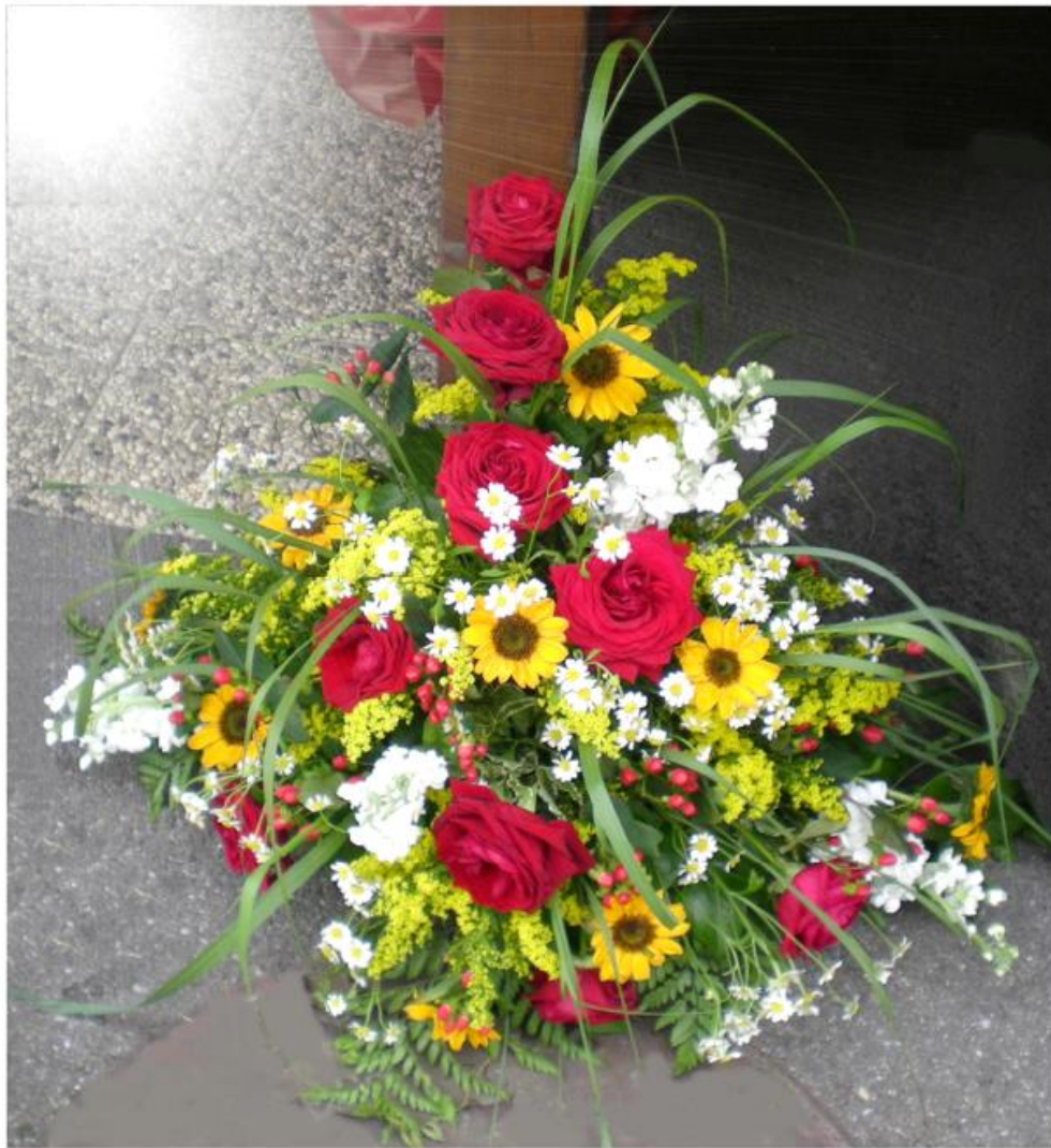
Hat Katharina zur Entspannung Blumengebinde ähnlich diesem hergestellt?

Mehrmals habe ich mich gefragt, ob nicht auch Katharina als Mystikerin hin und wieder eine Pause benötigte, eine Auszeit, eine Tätigkeit, bei der sie sich einfach entspannen konnte! Da stieß ich in den Aussagen eines Zeugen ihres Heiligsprechungsverfahrens, dem „ Prozess von Castello “, auf Überraschendes: Katharina liebte es, Blumengebinde herzustellen, Sträußchen, Kränze und Kreuze, welche „süßen Wohlgeruch“ ausströmten und die Herzen und Nasen aller erfreute, die sie damit beschenkte. „Darum geschah es, dass auch ich... manche Kreuze und Blumensträuße geschenkt bekam.“ (Der Prozess von Castello, 56-58).